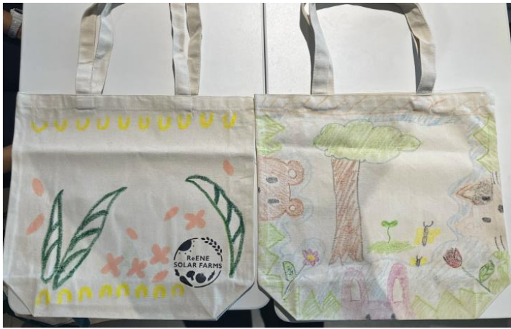
▲オリジナルエコバックづくり